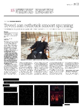
Merkel-moment in de opera.